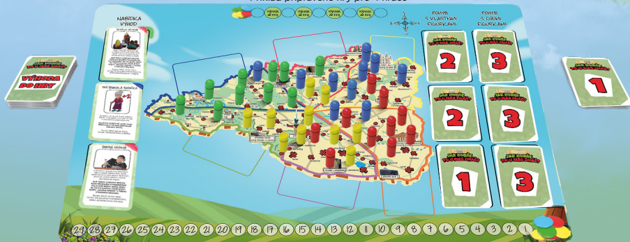
Příklad připravené hry pro 4 hráče